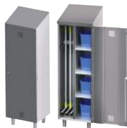
MAC06 + pieds inox (MAC06X)

* Seaux, balais, balayettes et ramasse-poussière non fournis